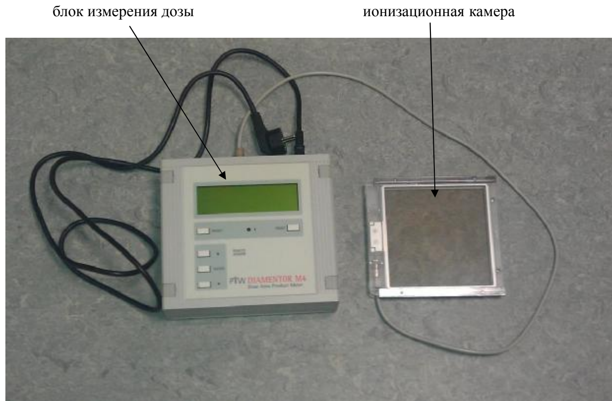
Рисунок 1 – Общий вид дозиметра

Общий вид дозиметра представлен на рисунке 1.